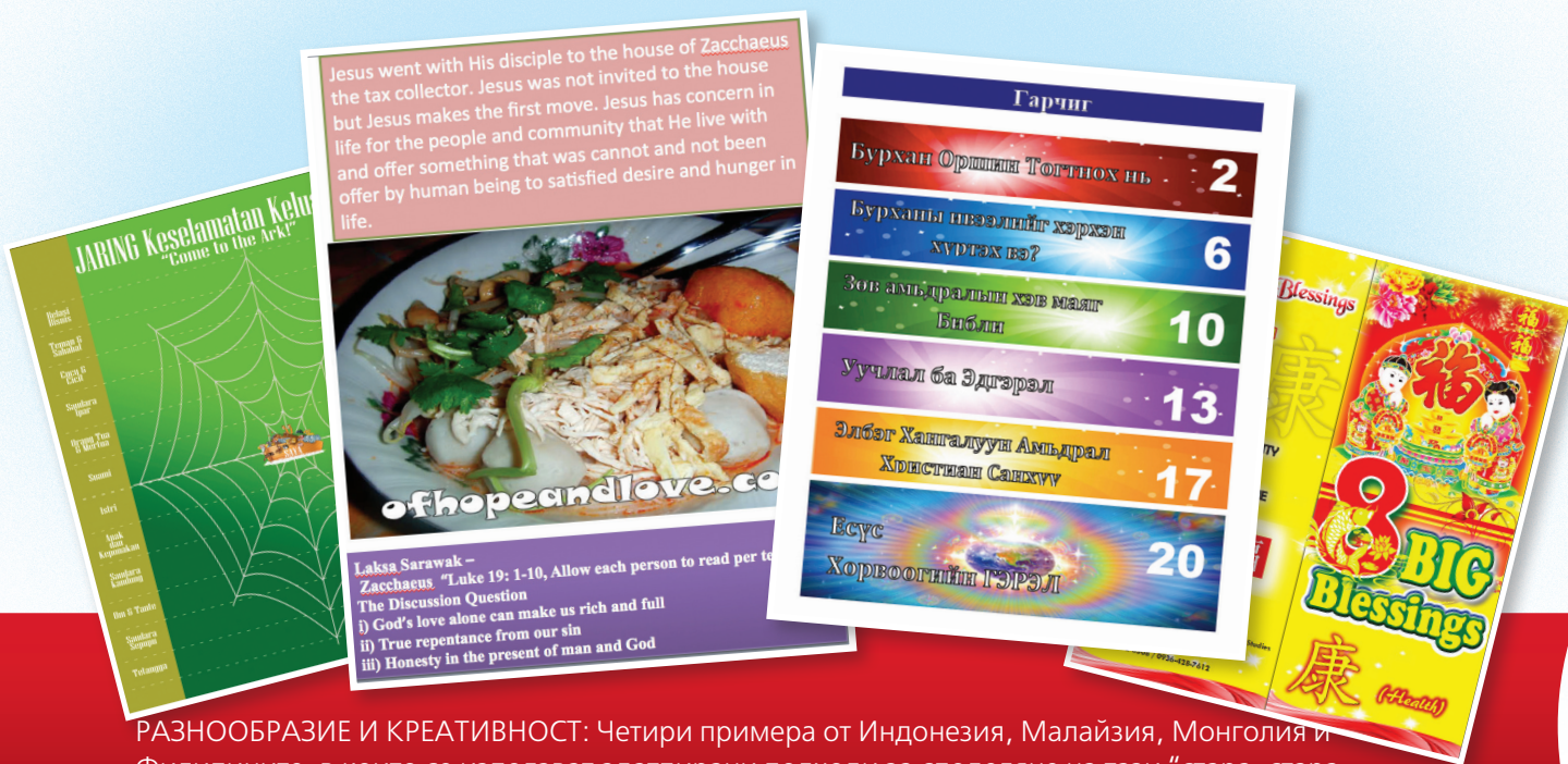
РАЗНООБРАЗИЕ И КРЕАТИВНОСТ: Четири примера от Индонезия, Малайзия, Монголия и Филипините, в които се използват адаптирани подходи за споделяне на тази "стара, стара история."