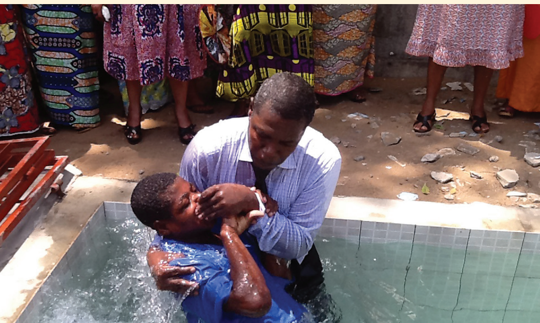
Затворниците от затвора Ломе се кръщават в новия басейн.

брой хора - 1 167 796 - са се присъединили към адвентната църква през изминалата година, което е повече от 1 091 222 души, прибавили се през 2013 г., и предишния рекорд от 1 139 000 през 2011 г.