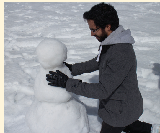
Мисионер от Южна Америка прави снежен човек по време на едно пътуване до Северен Ливан.