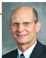
Тед Н. К. Уилсън е председател на Църквата на адвентистите от седмия ден.

Госпожа Виктория казва: „Мечтата ми се сбъдна!“